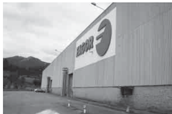
破綻したFAGOR Electrodomesticosの工場

(注3) アメリカ発のサブプライム証券がロンドンで多数の欧州金融機関に売りさばかれ、これを抱えたフランス第1位のBNPパリバ銀行で07年8月に「パリバ・ショック」となってサブプライム危機が欧州で爆発する。そして、08年9月