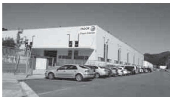
FAGOR Ederlan (モンドラゴンHPから)

元来、モンドラゴンの協同組合は、バスク地方の労働者が組合員になって組織した労働者協同組合であり、バスク地方以外で