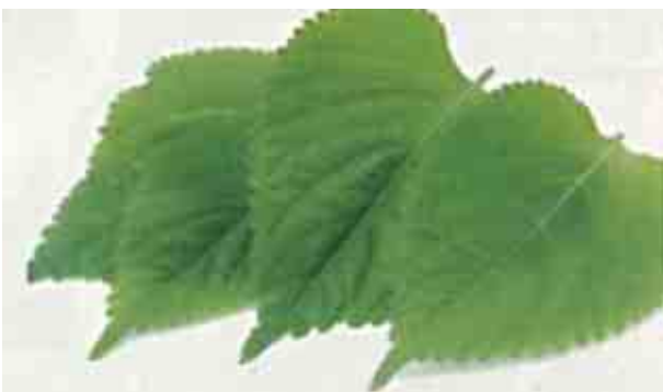
エゴマの葉(富山市資料より引用)

エゴマは、シソ科の一年生植物であり、葉や種子にアレルギー疾患や認知症予防に高い効果を示す成分が多く含まれていることで、