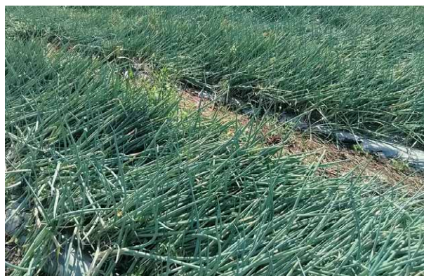
写真 台風によって倒伏被害を受けたねぎ畑(こと京都株式会社より提供)

こと京都のもう1つの台風対策として、生産・供給拠点の広域化があげられる。現在、同社は京都市の本社に加え、京丹後市、静岡県藤枝市、岩手県陸前高田市、北海道伊達市にそれぞれほ場や工場を設けている。これらの拠点整備は主に経営規模の拡大を目的としているが、台風リスクの分散にもつながって