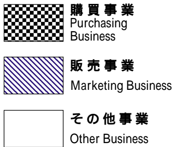
漁 協 Fishery Coops 平成11年度 Business Year,1999 (17,027)